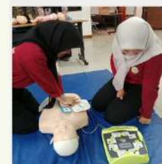
WORKSHOP BASIC LIFE SUPPORT FOR FIRST RESPONDERS / LAY PERSONS - BATCH 8 30 AGUSTUS 2024