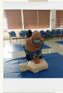
WORKSHOP BASIC LIFE SUPPORT FOR FIRST RESPONDERS / LAY PERSONS - BATCH 7 23 AGUSTUS 2024